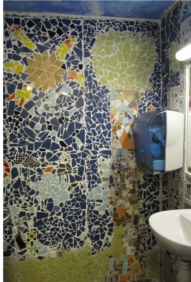
Toilet med eventyrtræer - før og efter Bemærk - papirautomat er nu kommet ned i børnehøjde