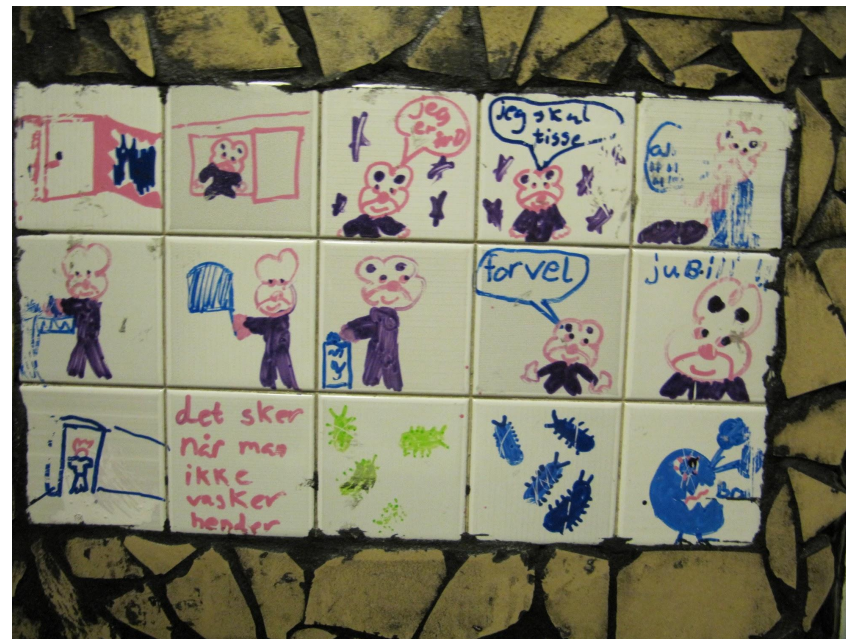
Tegneserie om hvad der sker, hvis ikke man vasker sine hænder