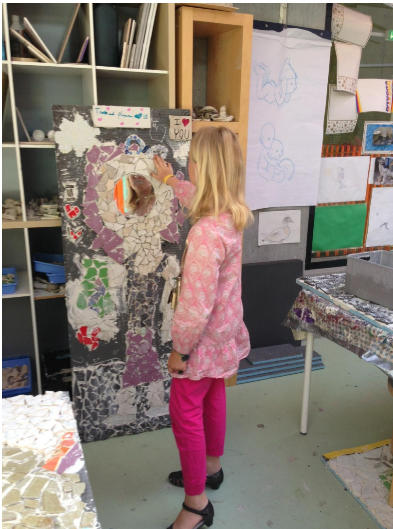
Igangværende arbejde med mosaikvæg til "Moviestar-toilet", hvor barnet kan se sit eget ansigt i det runde spejl og forestille sig at være mosaikfiguren.