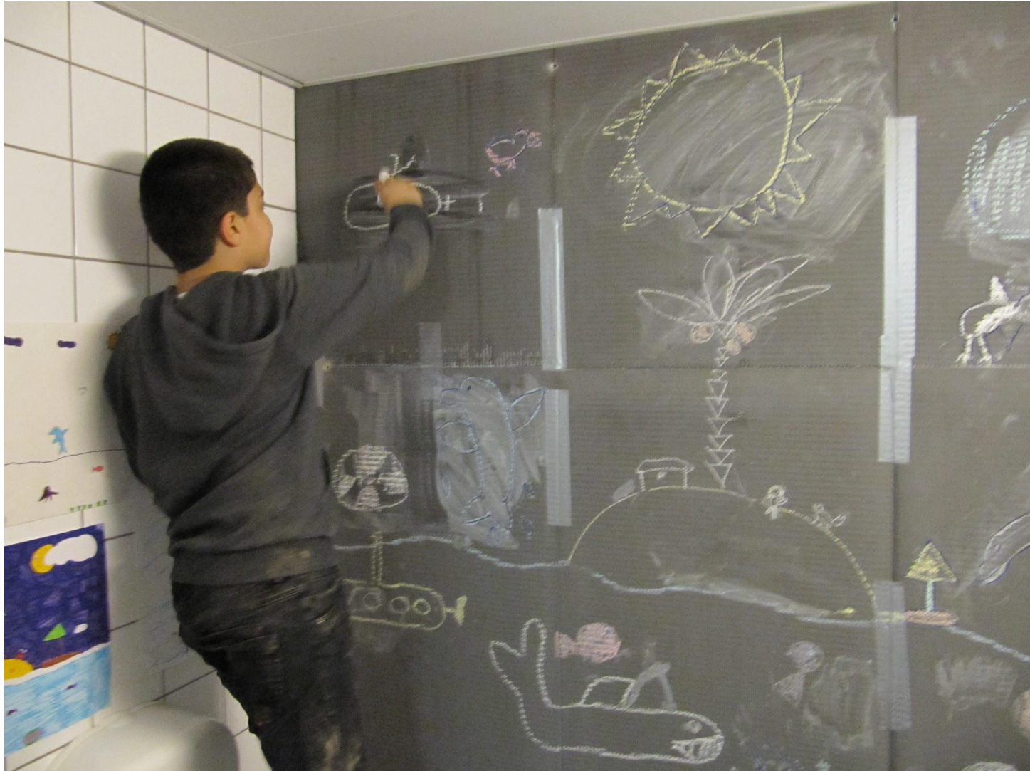
Skitsetegning på wedi-plader